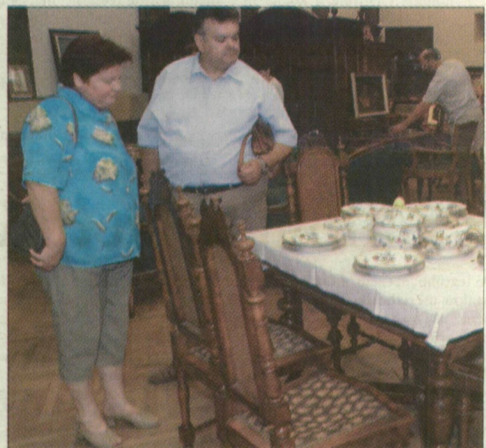
A kapitány feleségével. A régiségekhez is ért