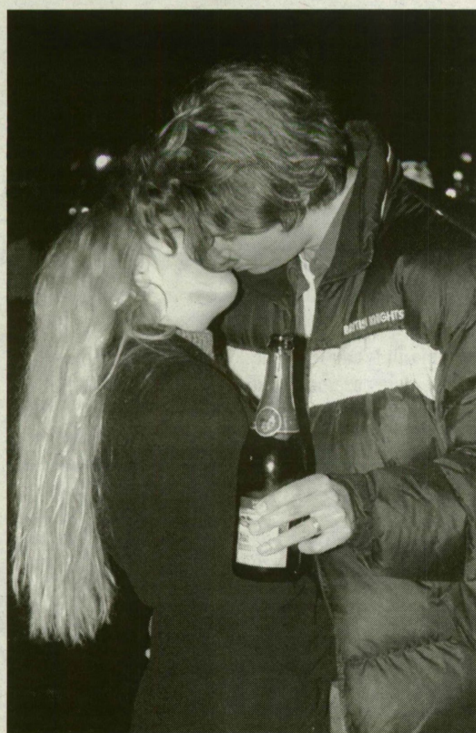
A pezsgő mindig feldobja a szilveszteri hangulatot

A flöte – hosszú, keskeny, esetleg csak felül kiszélesedő pohár – ideális a pezsgő számára, míg a