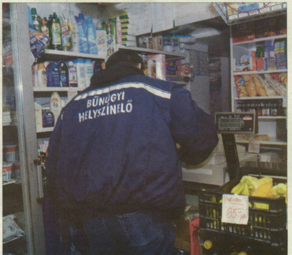
Egy helyszínelő rendőr a tegnapi rablás után

A rendőrség néhány perccel később már a helyszínen volt. A bűnügyi technikusok ujjlenyomatokat kerestek a bejárati ajtón és a pénztárgépen. A fiatal eladót beszállították a rendőrkapitányságra, kihallgatása lapzárta-nyitáskor még tartott.