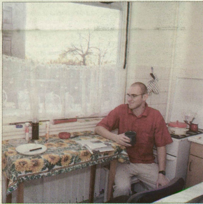
Öthalmi konyha mint tanulószoba