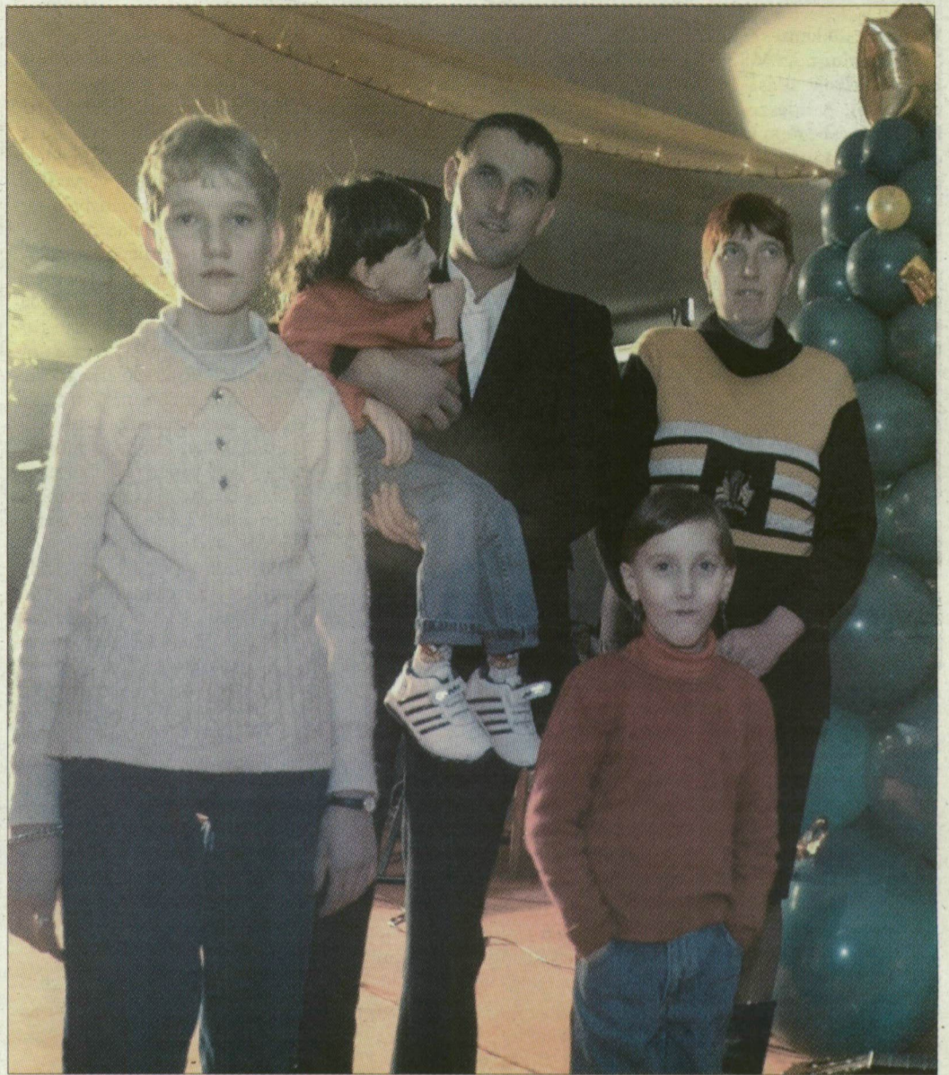
A kisperegi család sok ajándékot kapott

Miután az ünnepség lezajlott, Szabóék a sajtó kérésére átmentek a nagyterembe, ahol fényképek készültek a nagylányról, Bri-