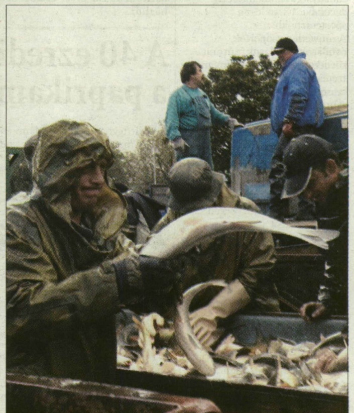
A Fehér-tavi halgazdaság szinte az egész Alföldet ellátja karácsonyi hallal