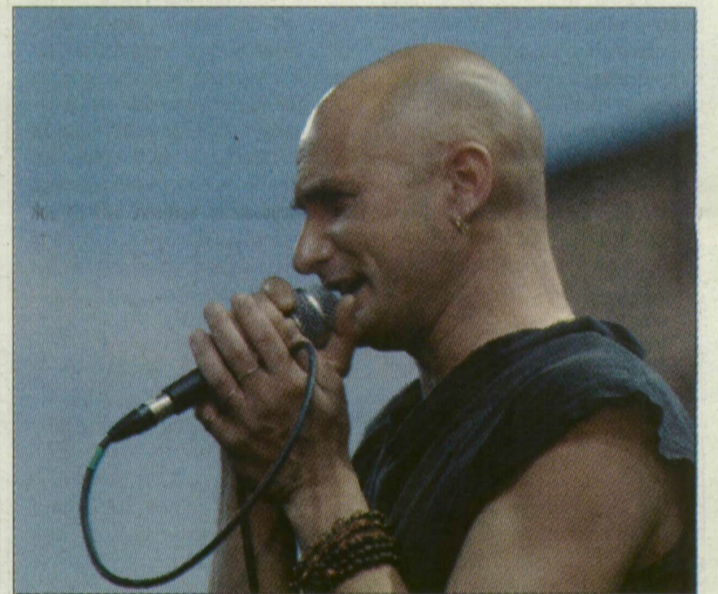
Cipő legutóbbi szegedi koncertjén