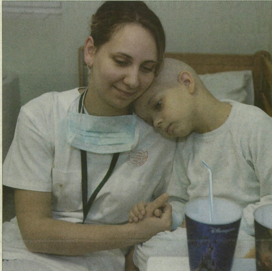
A kis beteg és ápolója is barátságosabb környezetben küzdhet a gyógyulásért.