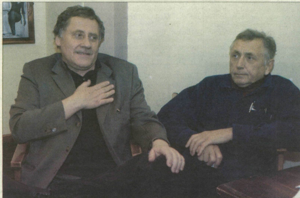
Koltai Róbert és Jiri Menzel nemcsak a filmvásznon világszámok