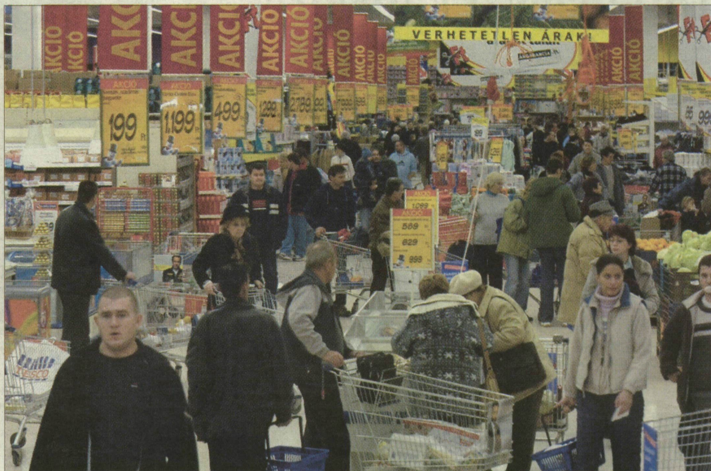
Vevők roham a szegedi Tescóban. Akciók, minden mennyiségben