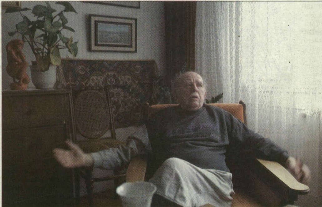
„Megkerestek és közölték: el tudják intézni, hogy hetven napot tölthessek Angliában”