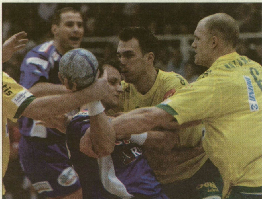
Egy küzdelmes pillanat a mérkőzésről