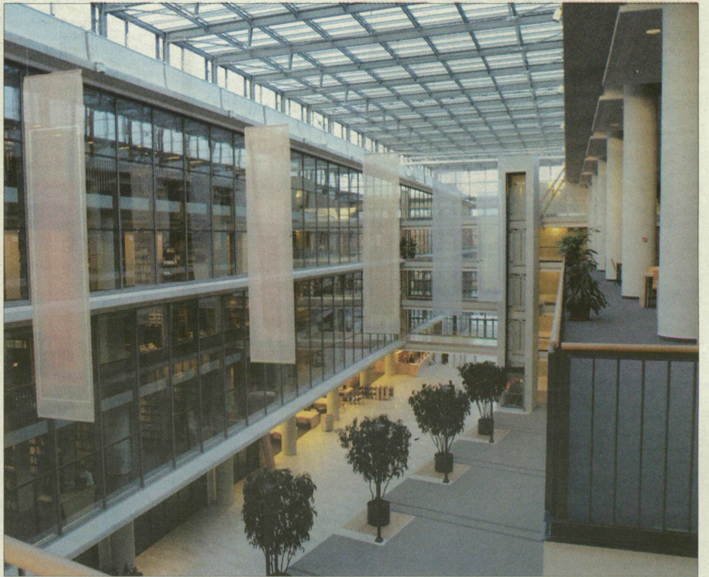
Az épület belső tere lenyűgöző

– Különösen állami beruházásoknál szokatlan ez Magyarországon. Bár a szegedi építkezés sem volt problémamentes, mint ismert, többször módosítani kellett a terveket, a határidőket, mégis el lehetett érni, hogy ne lépjük túl az évekkal ezelőtt megállapított beruházási keretösszeget. A műszaki tartalmak némi módosításával olcsóbb, de a célnak ugyanolyan megfelelő anyagok beépítésével. Azt mondhatnám, eggyel kisebb lett a kényelem, kevesebb a komfort. Mondok példát: a konferenciateremben fényvetőket, azaz reflektorokat szeretnénk volna elhelyezni, ez egyelőre nem sikerült. A helyük megvan, később, ha lesz rá pénz, felszerelhetők.