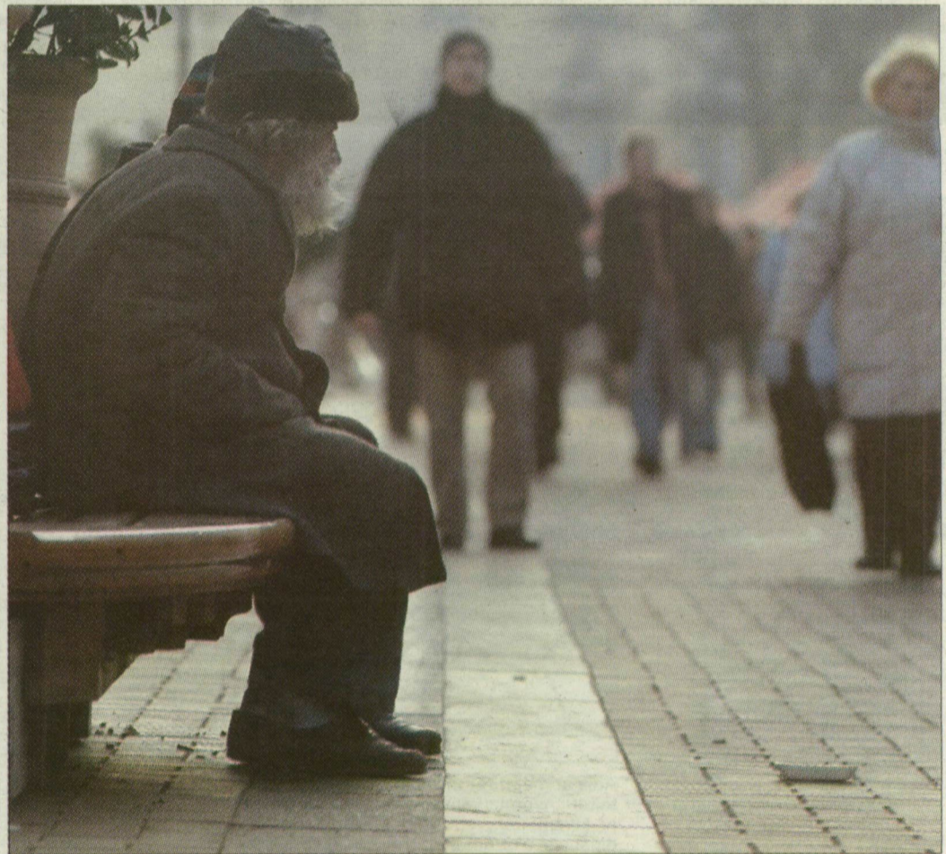
Munka nélkül lassan telnek a hajléktalanok napjai a Kárász utcán