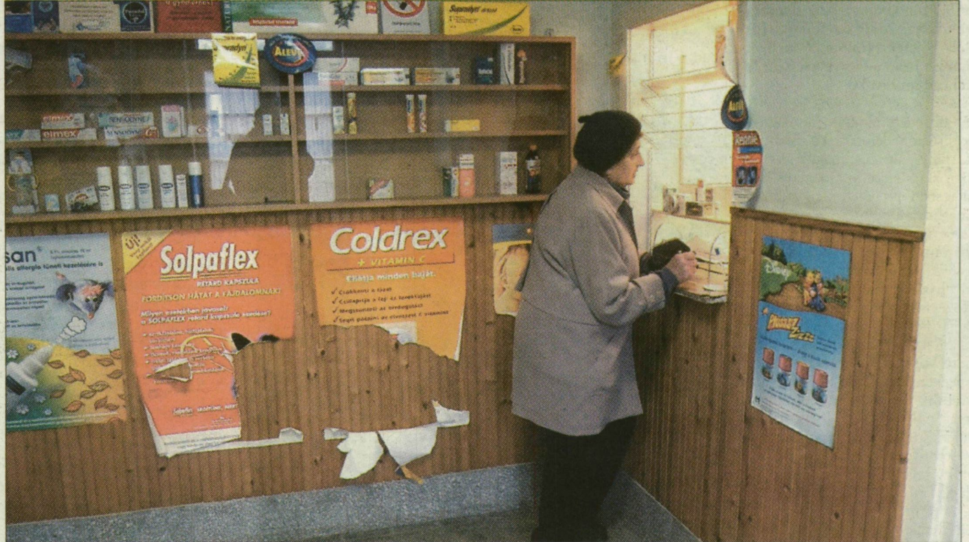
A kétezer lelkes település elvileg el tudna tartani egy gyógyszerészt