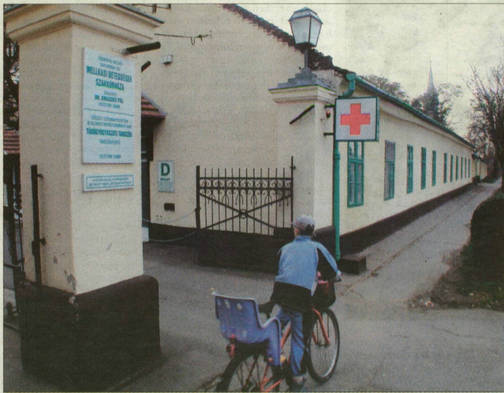
Idén már nem nyúlnak hozzá a csaknem százötven éves, életveszélyessé nyilvánított épülethez, pedig alaposan ráférne a felújítás