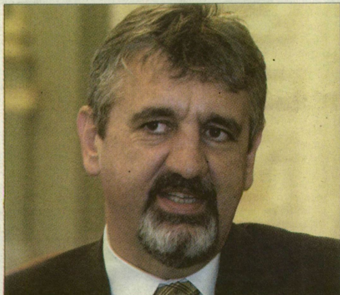
A rektor szerint erősödhet a campus-jelleg