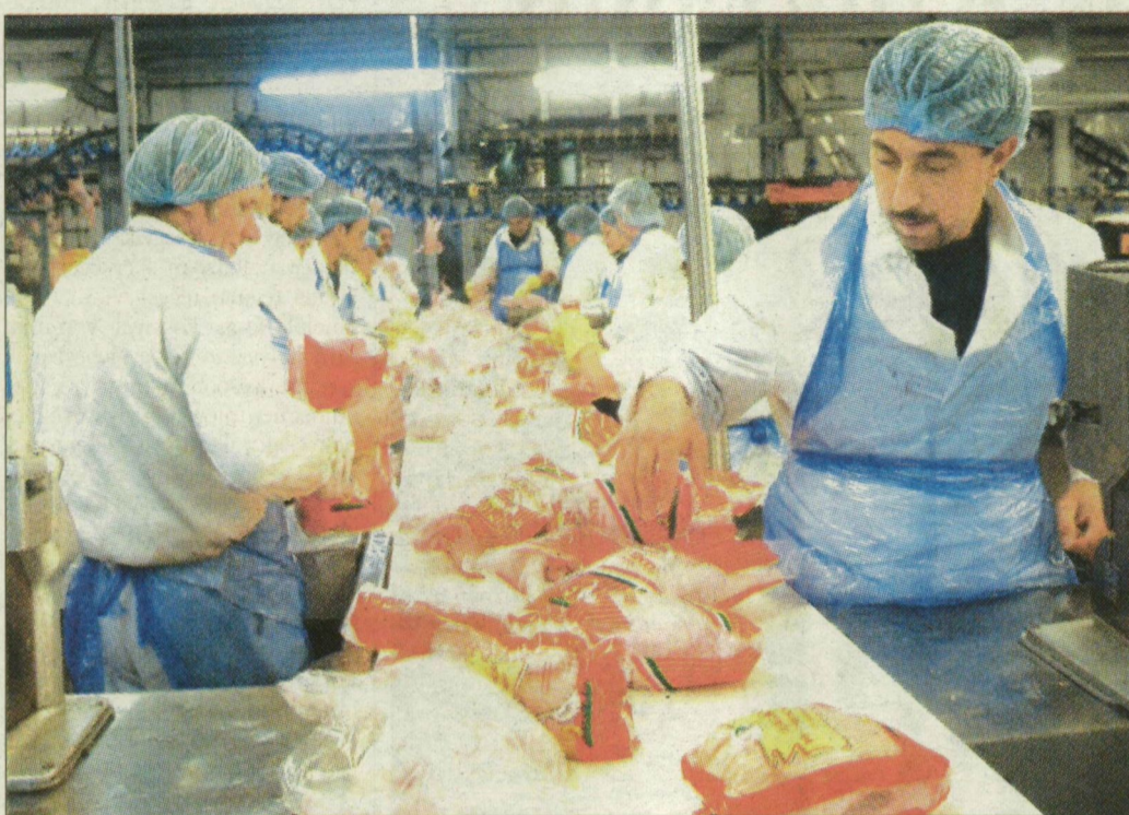
Kacsasomagolás a Hungeritnél. A cég vágóhídján rendszeresen vizsgálják a húst. Most is kiderült: ez a munka igenis létfontosságú

Egy Csongrád és egy Bács-Kiskun megyei termelőtől kerültek a Hungerit vágóhídjára azok a kacsák és libák, amelyek húsban egy 1987 óta betiltott gyógyszer jelenlétét mutatták ki. Az érintett húst az állat-egészségügyi állomás zárta – a hatóság szerint a szentesi feldolgozóüzem véten az ügyben. A szert tartalmazó halliszt Izlandról utazott a magyar takarmányüzemig.