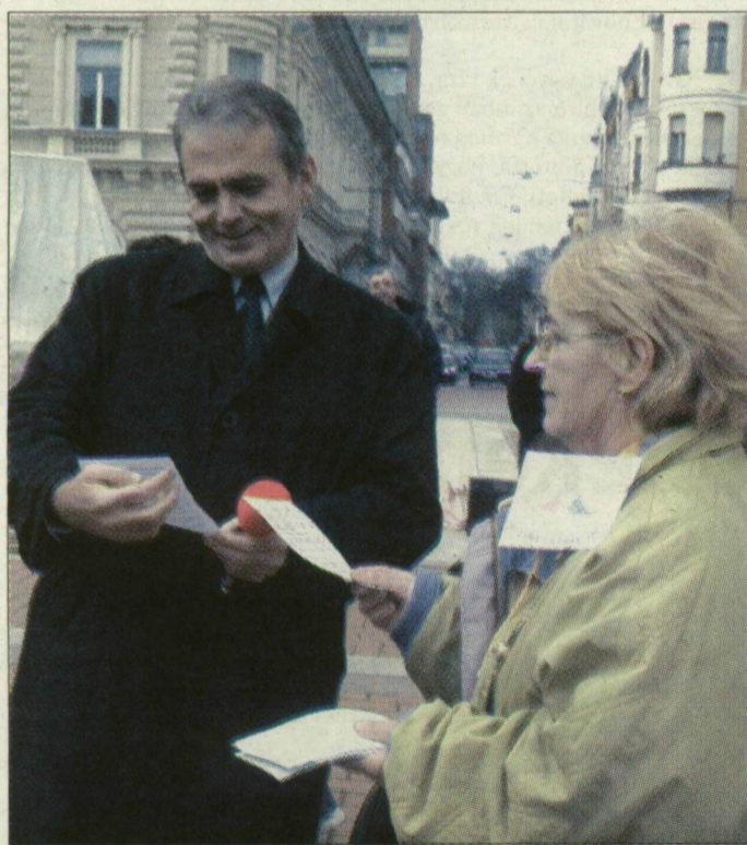
A sajtótájékoztató végén Thürmer Gyulától kérdezhettek az érdeklődők