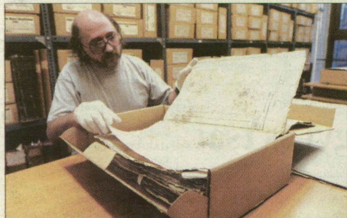
A régi iratok veszélyes gombákat is rejtnek