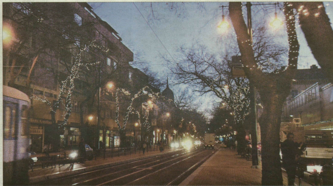
Díszkivilágítást kapott a Tisza Lajos körút is