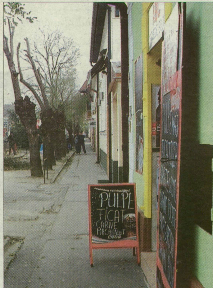
Román fölirat Makó főutcáján: harcban állnak a külföldi vásárlóért

Ugyanakkor – mint azt a Megyeház utcán sétáló megállapíthatja – a kisboltok fölvetették a kesztyűt, nem hagyják magukat. Hirdetőtábláikon csirkecombot, zúzárt, kolbászt, sört kínálnak – románul. Az üzletben persze készségesen lefordítják a betérő magyar vevőnek, mi is áll odakinn a táblán. A vállalkozó szerint e föliratok alkalmazása teljesen magától értetődő marketingfogás. Nem kell hozzá egyetem, bárki beláthatja: szívesebben jön az idegen abba a boltba – gyakran még akkor is, ha pár forinttal többet kell fizetnie –, amelyik az ő anyanyelvén kínálja a portékát.