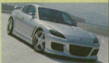
A képen optikai kiegészítővel felszerelt autó látható!

RXS modellek KOMPROMISSZUMMENTES AUTÓZÁS A MAZDÁVAL 7 299 900 Ft-tól 192-231 LE a hátsó kerekeken Főbb jellemzők: WANKEL motorral Klíma El. ablakok és külső tükrök Hifi hihetetlen hangminőség ABS-EBD-ASR Távvezérelt központi zár 4 ajtó, 4 személyes kivétel 6 s alatt 100 km/h sebességen