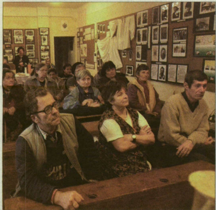
Az első előadást hamarosan újabbak követik

A pályamunkákat a következő címre kell eljuttatni: Shankar's International Children's Competition, Nehru House, 4 Bahadur Shah Zafar Marg, New Delhi-110002. Beküldési határidő: december 31. A pályázati felhívást az Oktatási Minisztérium kérésre postai úton is eljuttatja, cím: 1884 Budapest, Postafiók 1. Telefonszám: 06/1-473-7670, 06/1-473-7433, honlap: http://www.om.hu/ .