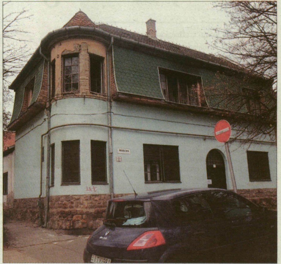
Az emeleti lakás vált használhatatlanná