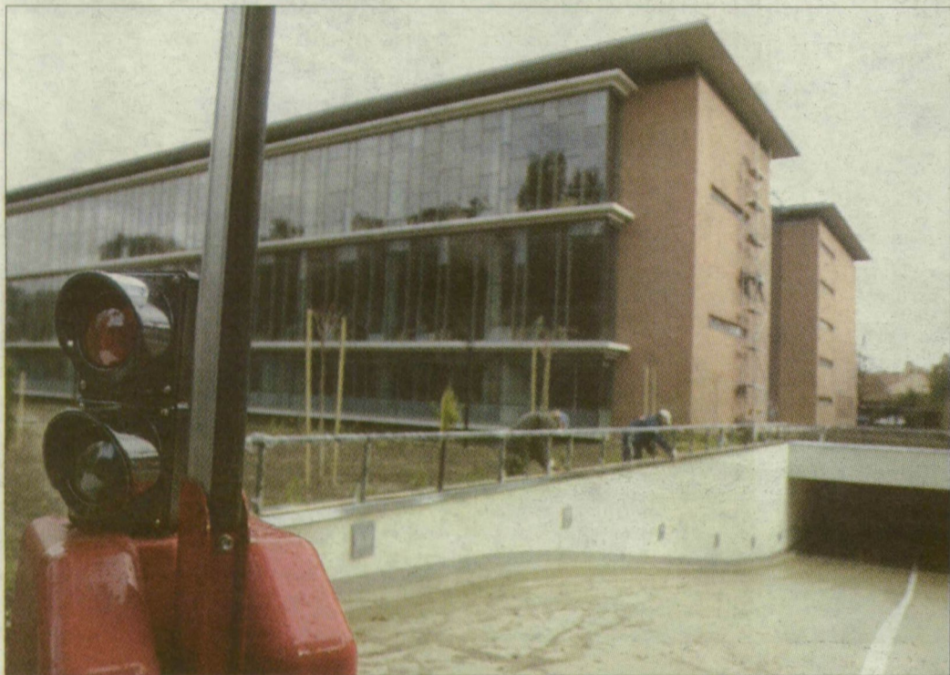
Egyetemi tanulmányi és információs központ – a szegénység pazarlása