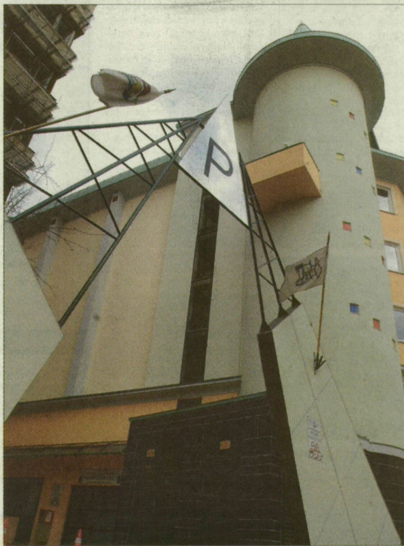
Szegedi parkolóház – sok-sok kérdőjellel

Csak hogy az Arany János utcában épülő első szegedi parkolóház kivitelezésével is bajok akadtak. A teljesítési határidőt többször módosították, a beruházás költsége 730-ról közel 900 millió forintra emelkedett, ráadásul nem kapott használatbavételi engedélyt, mert a rendszer szoftverje és automatikája működésképtelen volt. Mindennek a tetejébe eltűnt a svéd fővállalkozó, anélkül, hogy kifizette volna az alvállalkozókat, vagyis a pénzzel együtt. A városnak, illetve parkolási cégének kötbérvétel-