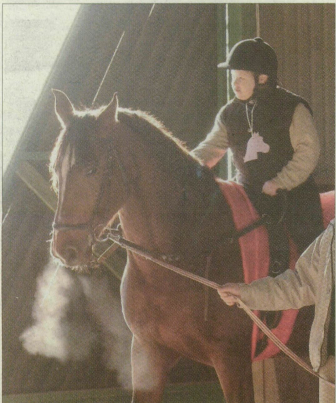
Az ország különböző pontjairól érkeztek a diákok a vásárhelyi rendezvényre

Telt házas Tankcsapda-koncert az Etelka sori csarnokban