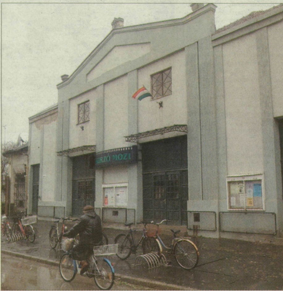
A Korzó mozi ma is a szórakozás egyik helyi fellegetvára