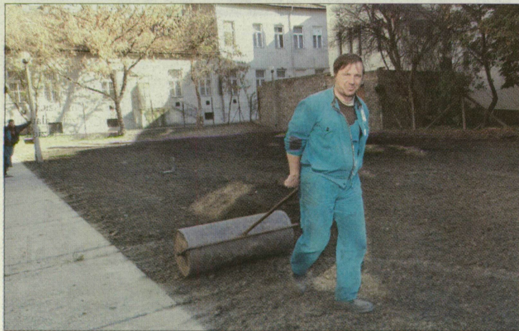
A Zászló utcai tömbelsőt talajcsere után gyepesítették