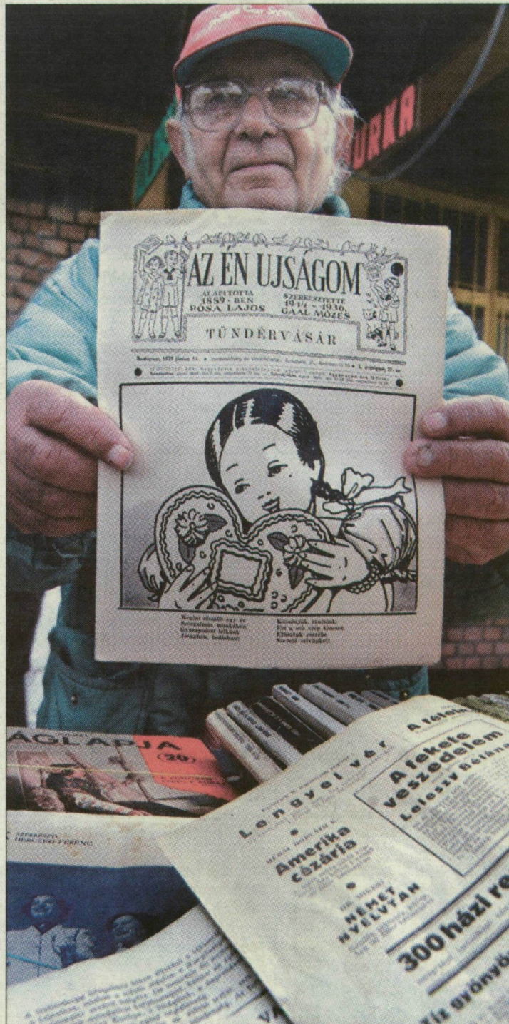
A Szent István téri piacon könyvritkaságokra is bukkanhat, aki szerencsés

– Nézze, édesanyám nagyon olvasott, okos asszony volt. Akkoriban, a Horthy-rendszerben 3-4 pengő volt egy-egy könyv. Nem is vásárolta: cserélgette őket. Tiltott is minket, gyerekeket némelyiktől. De hát milyen könyvek voltak azok, ma a kora délutáni gyermekműsorokban több tiltánivalót lehetne találni, mint bennük volt. Meg az iskola. Pad alatt olvastunk. Ha a tanító meglelte, hogy állandóan a könyveket bújjuk, elkobozta a köteteket, s csak egy hét múlva kaptuk őket vissza. Micsoda büntetés volt, egy teljes héti olvasás nélkül! Alig lehetett kibír-