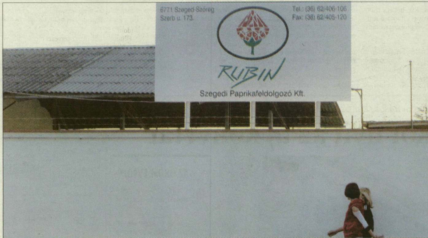
A Rubin Kft. szőregi feldolgozója