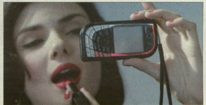
Szépség és technika

Talán a technikának nem kell másnyilvánulnia, csak a nyelvezetet kell megváltoztatni, amely megmagyarázza és eladja azt. A női magazinok például nem közölnék műszaki leírásokat, sok nő viszont idegenkedik a műszaki magazinoktól. Egyesek a nők által szerkesztett weboldalakhoz fordulnak, hogy közvetlenebbül figyelhessék meg a kínált termékeket.