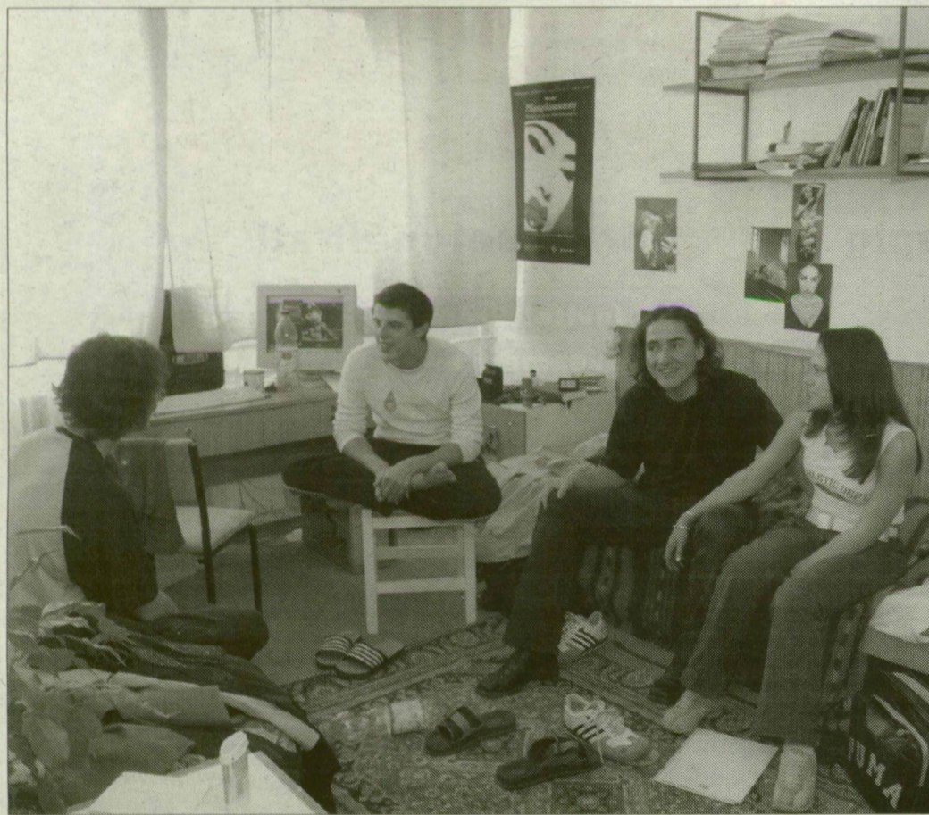
Hallgatók az óthalmi diákszálláson. Új lakásokat alakítanak ki