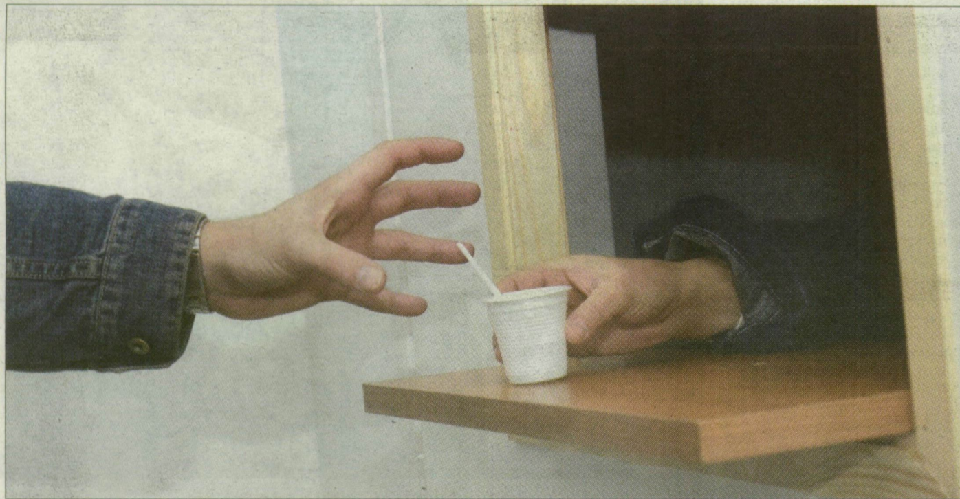
A kábítószerrel „le lehet jönni”