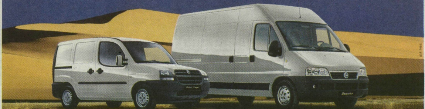
Doblo Cargo 1.3 Multijet

Új, erősebb motorok a Fiattól, akár nettó 545 000 Ft kedvezménnyel!