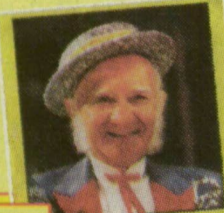
EÖTVÖS GÁBOR JÓZSEF SZÉKELY KÍSÉRE A HÍRŐRŐK SZERELMÉNYESEN ÉS KÖZÖSSÉGEKÉRT SZERETettel

Jegyek elővételben is kaphatók a cirkusz pénztáráiban, vagy telefonon megrendelhetők: 06-70/586-96-77 telefonszámon.