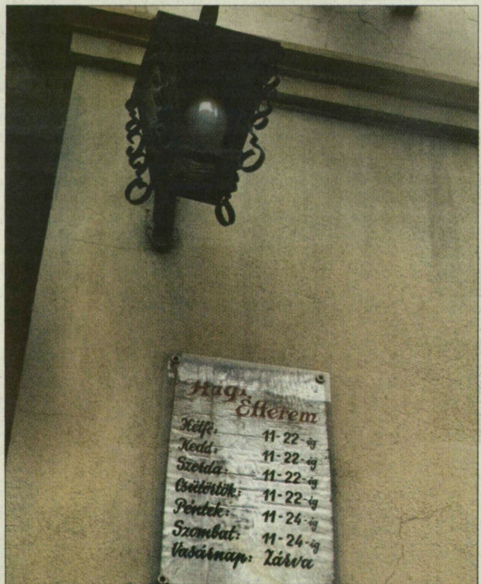
A Hági tovább pusztul