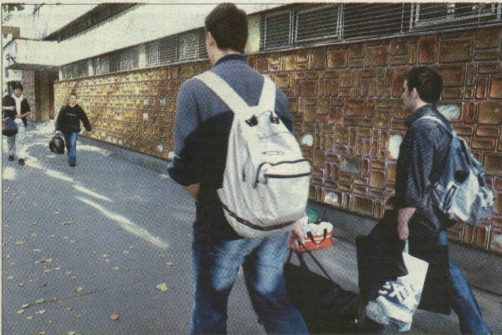
A szegedi középiskolások a hét végén az Ortutay-kollégiumban kapnak szállást.