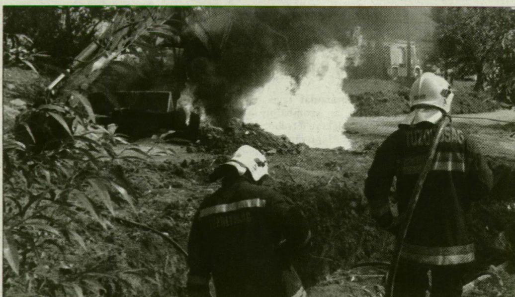
Legutóbb a szőregi csatornaépítésnél történt baleset