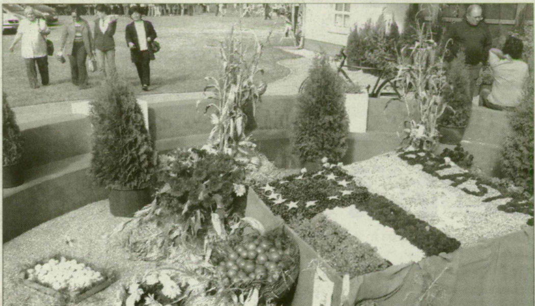
Zöldségekkel és virágokkal készített kompozíciók