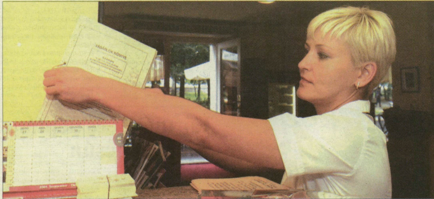
A jegyző által hitelesített, számozott oldalakkal álló panaszkönyv kötelező