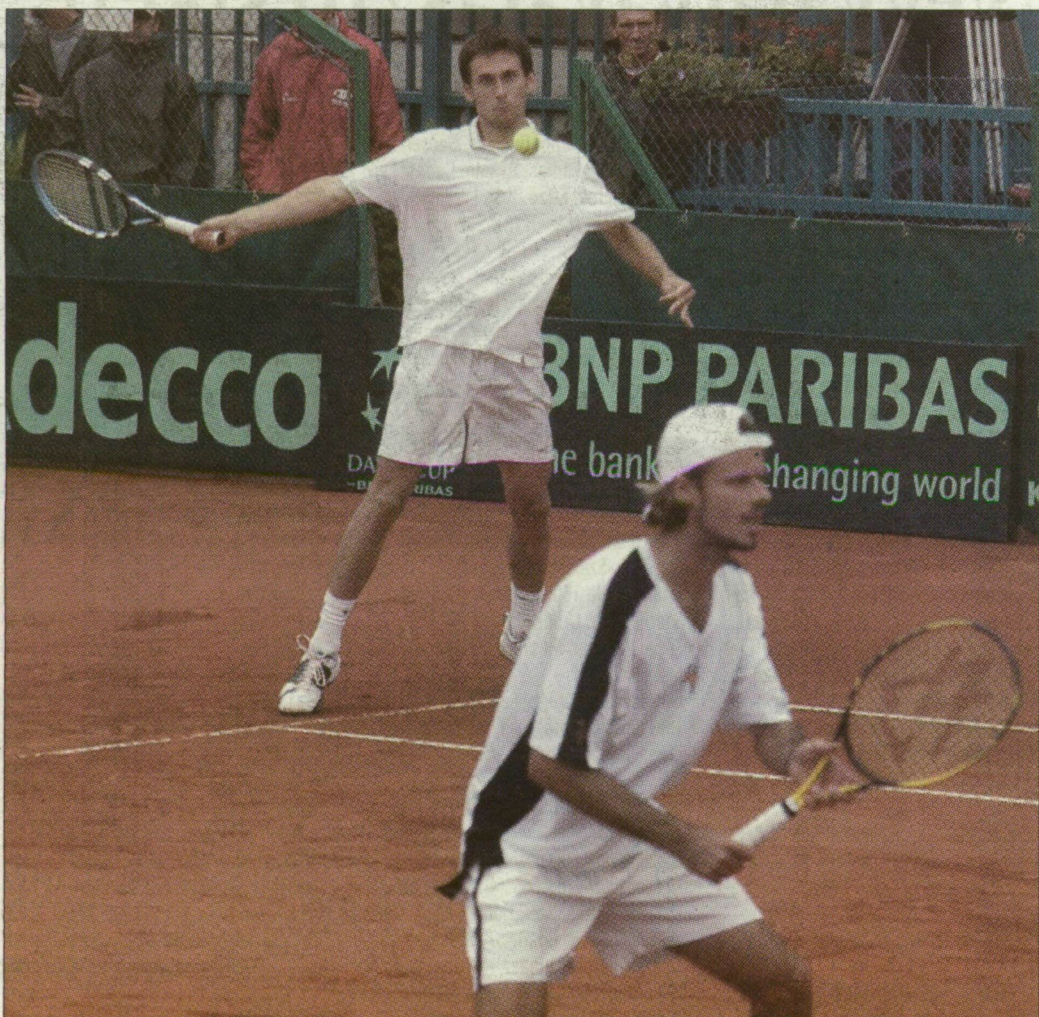
Bardóczkyknak és Kisgyörgynek nem sok esélye volt

A 77-70-es vereség azt jelenti, hogy Németország mellett másodikként Ukrajna jutott ki a csoportból a 2005-ös, Szerbia és Montenegróban sorra kerülő Eb-re, míg a magyar csapatnak erre már csak a jövő augusztusi pótszelejtő tornán lesz lehetősége.