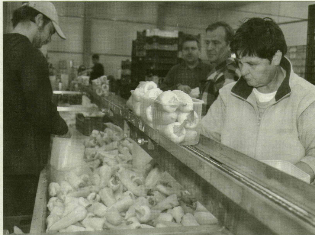
A paprikát szállítás előtt osztályozzák és csomagolják

A Mórakertet 1995-ben ötvenketten alapították. Családi, egyéni gazdálkodásra épül a szövetkezet. A mezőgazdaságból élő homokháti emberek összefogásának jó példája a mórakerti székelyház szövetkezet. A termelt zöldségnek, gyümölcsnek közösen keresnek piacot.