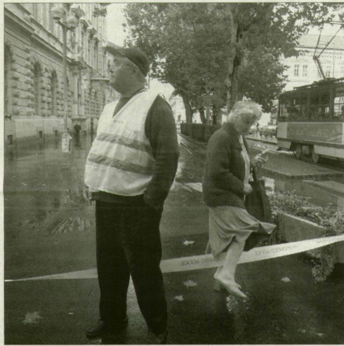
Lezárták a nagyposta környékét is