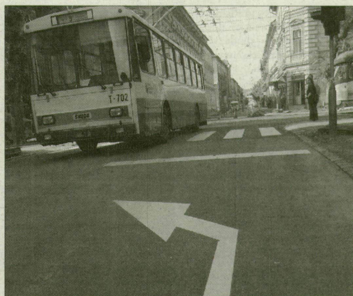
A buszok csak 12 óra után térhetnek vissza eredeti útvonalukra