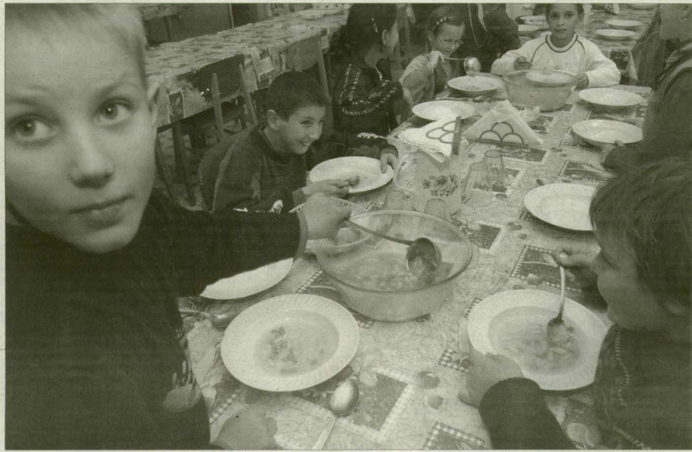
A tiszaszigeti kisdíákok a helyi vendéglőben ebédelnek