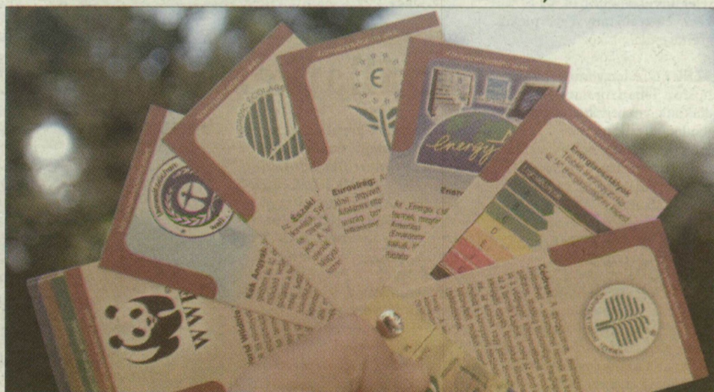
A Csalán Egyesület kiadványa az ökocímkek tára