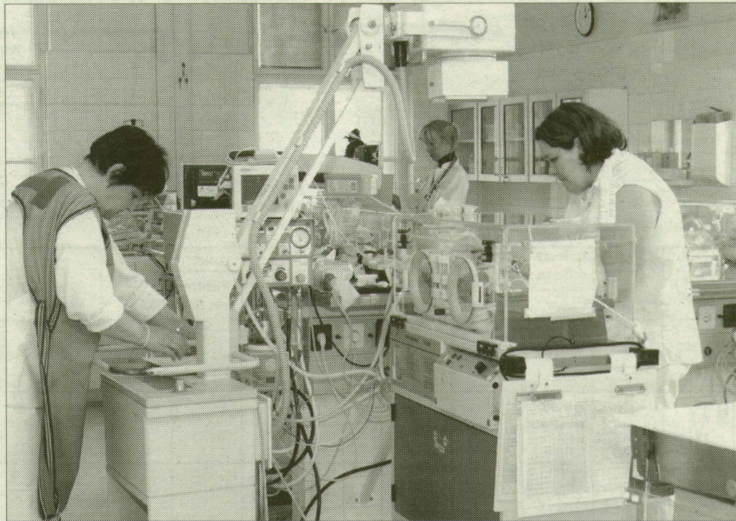
A szegedi gyermekklinika intenzív osztálya

1963-tól huszonnyolc éven keresztül a klinikát tanszékve-