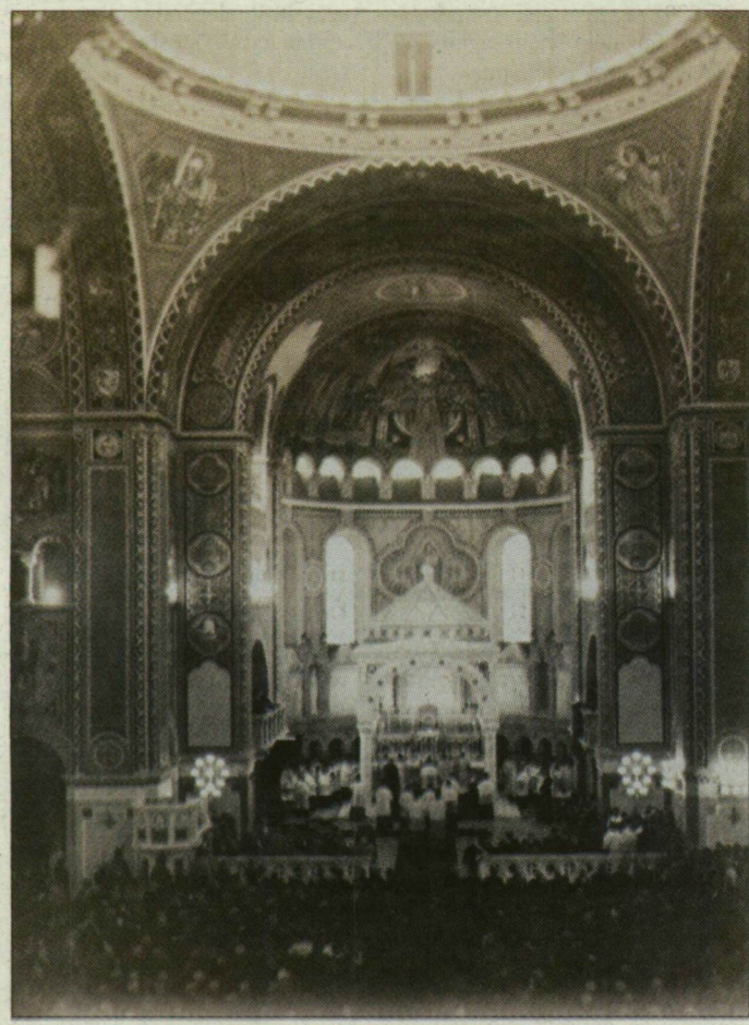
A szegedi székesegyház felszentelésének nagymiséje 1930. október 25-én

■ A 2000-es népszámlálás alapján a Csongrádra és Békésre kiterjedő egyházmegye területe: 10 ezer 851 négyzetkilométer. Lakossága: 875 ezer 157 fő, közülük katolikus: 358 ezer 107 fő. Plébánia: 120. Templomigazgatóság: 4. Papság létszáma: 102. Szerzetesek száma: 24. Állandó diakónus: 4. Az egyházmegye védőszentje Szent Gellért püspök, vértanú, az egyházmegye első püspöke. A székesegyház titulusa: Magyarok Nagyasszonya.