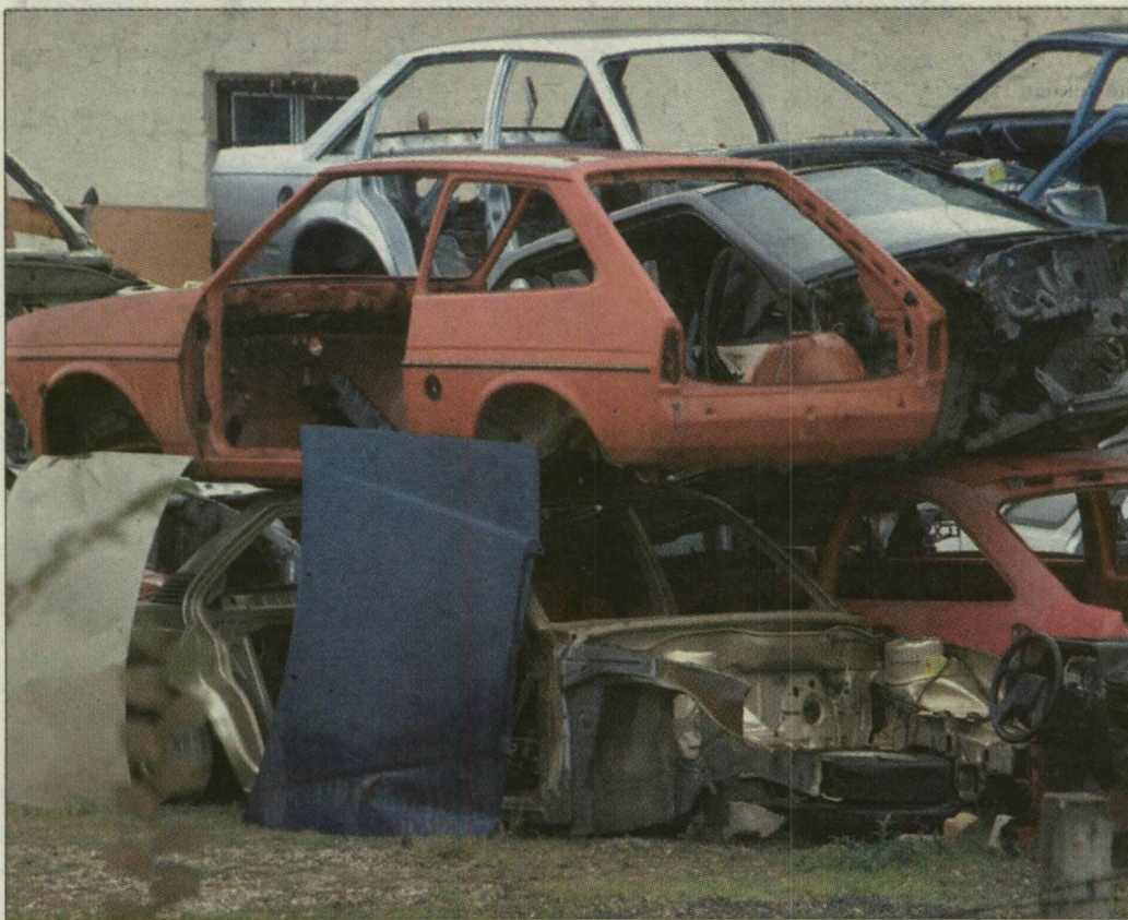
Roncslevegő Szegeden. A gyártók gondja az újrafelhasználás