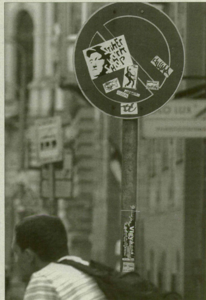
A vandál rongálók a magasan elhelyezett közlekedési táblák sem kímélik

A busz megállókban a menetrendi tájékoztató cseréje Tisza Volán Rt. feladata. Am csak eseti jelleggel egyetlen ember dolgozik azért, hogy tisztább és olvashatóbb legyen például az autóbussz indulási idője. Az oszlopok is az Rt. felügyelete alá tartoznak, s