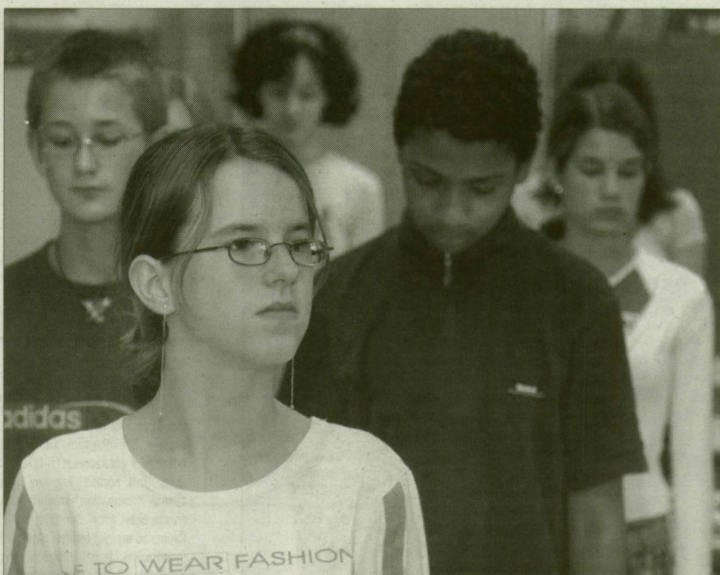
Megrendítette a zrínyis gyerekeket