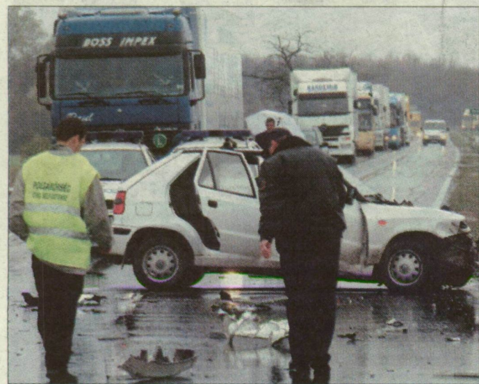
Nem ritka a napi tíz baleset