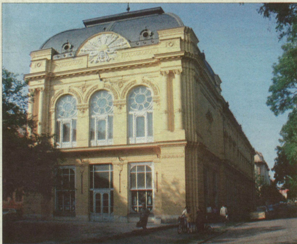
Késő ősszel kezdik a szálló rekonstrukcióját