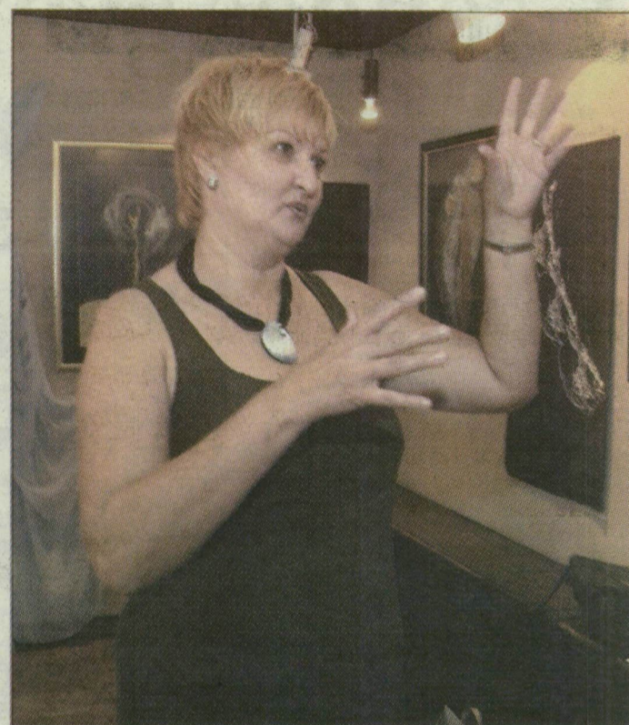
Titi Mária alkotásai között a szegedi galériában

Titi Mária a Tömörkény grafika szakán érettségizett, előbb a szegedi tanárképző főiskolán szerzett rajztanári diplomát, majd a Magyar Iparművészeti Főiskolán képezte magát tovább. Jelenleg a szegedi Gábor Dénes