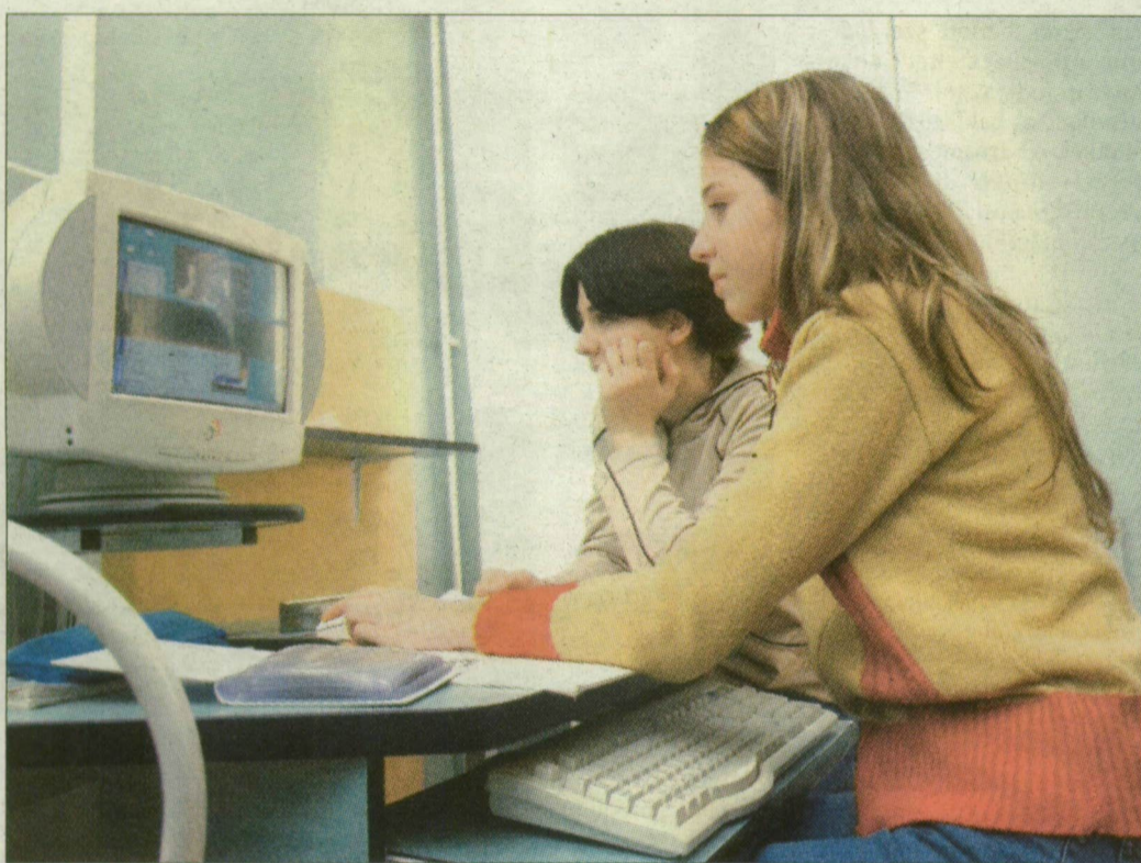
Nyert a szentesi kistérség is. A pénznek pedig van helye. A szegvári iskolában például már számítógép segíti az angoltanulást