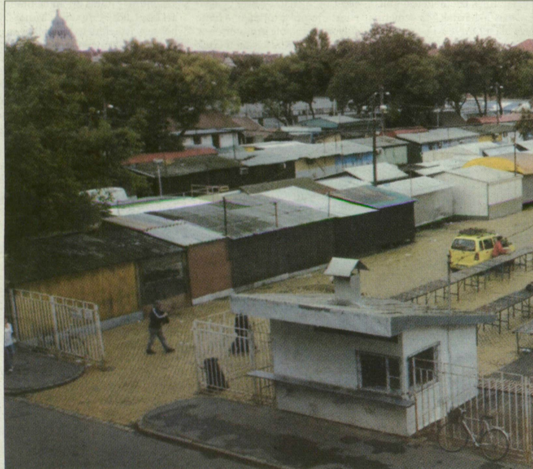
Amikor a Mars tér is még félálomban szendereg