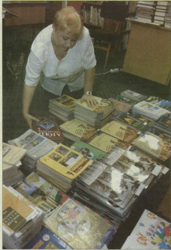
A szegedi Dózsa György Általános Iskolába már megérkeztek a tankönyvek

Városházi információink szerint a jogosult diákok számára az iskolák kötelesek minden olyan a könyvet ingyen biztosítani, amely az Oktatási Minisztérium által kiadott tankönyvjegyzékben szerepel. Ezt kötelesek megten-