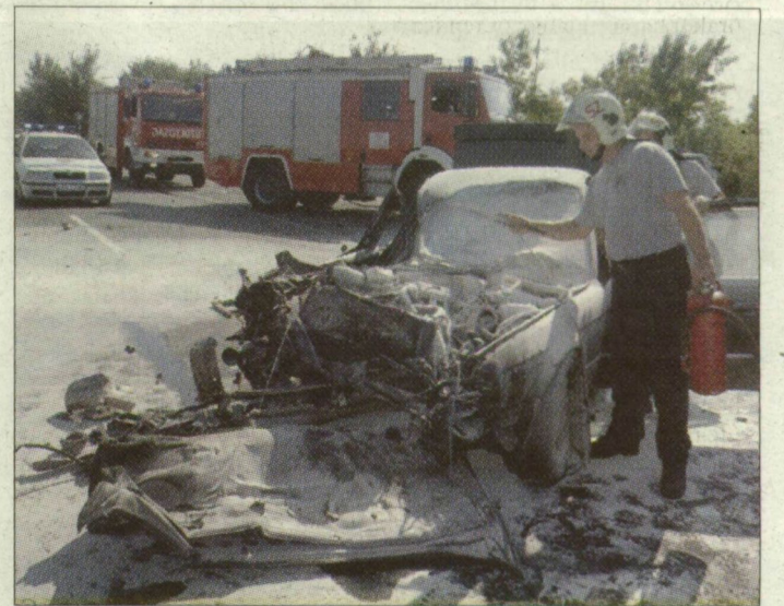
Az ütközés erejétől a BMW eleje összeroncsolódott, majd a kocsi kigyulladt