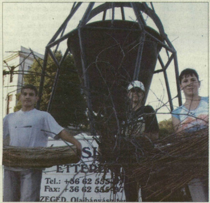
Minden készen áll ahhoz, hogy a hatezer személyes bográcsnak is alágyútsanak

A Huszár Mátyás rakparton a rendezvény vasárnap este éjfélig tart, a sátorbontás és a takarítás után, hétfőn reggel 6 órától újra megnyitják az utat a Tisza-parton közlekedők előtt.