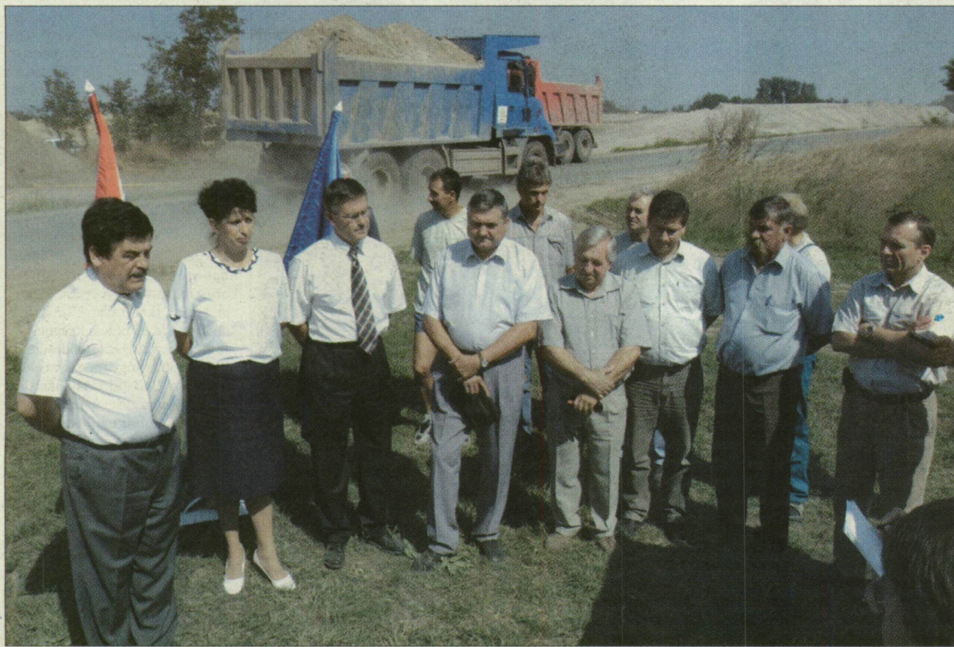
Az összefogás sajtótájékoztatója kormánypárti és ellenzéki képviselőkkel